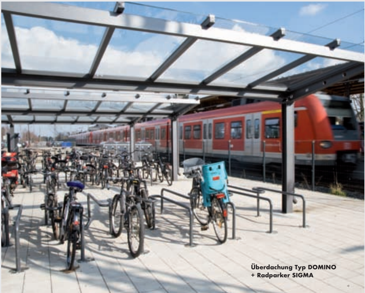
Überdachung Typ DOMINO + Radparker SIGMA