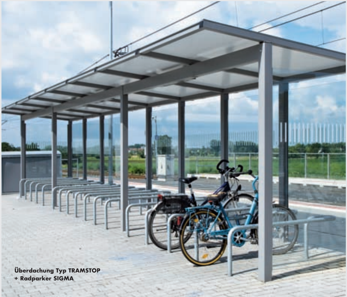
Überdachung Typ TRAMSTOP + Radparker SIGMA