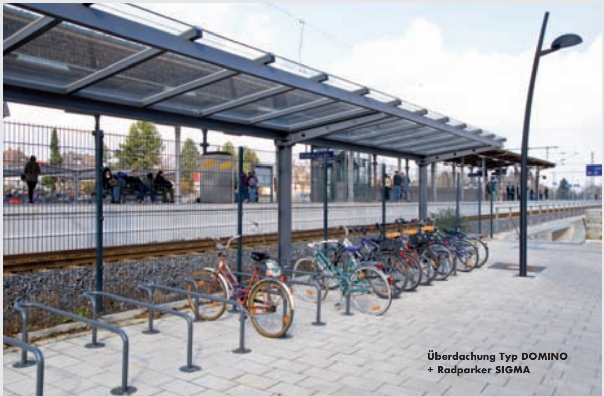
Überdachung Typ DOMINO + Radparker SIGMA